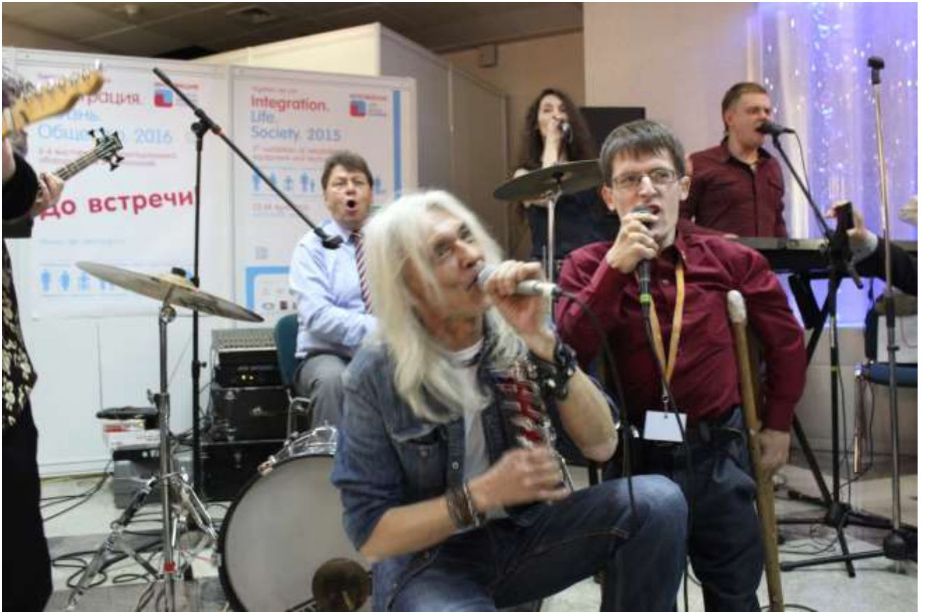
Проект содействует духовному развитию гражданского общества.